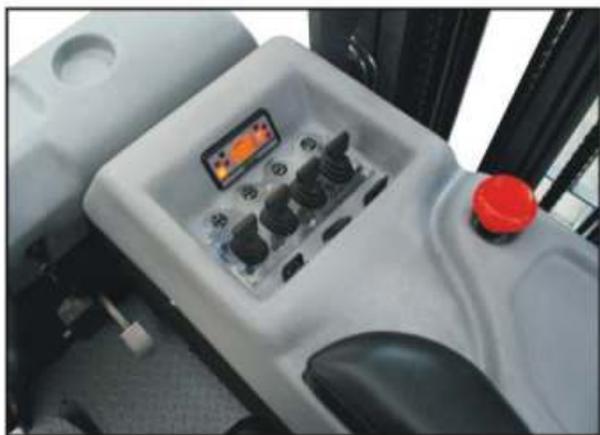
Controles eletrônicos por Finger Tips e display digital Curtis.